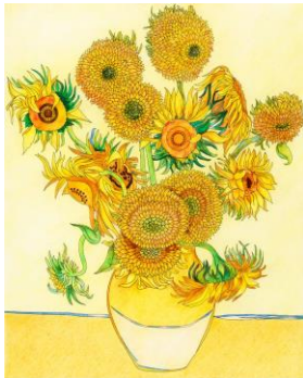
Van Gogh's Sunflowers

El North Grade Art Club se complace en anunciar su participación en el próximo Festival de pintura callejera de Lake Worth, donde recrearán la famosa obra de arte de Vincent Van Gogh, "Sunflowers." Si está interesado en ver esta obra de arte en persona, asegúrese de visitar Lake Ave durante el festival los días 22 y 23 de febrero de 2025.